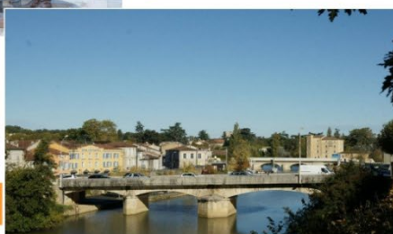
La Baïse et le Port

BULLETIN D'INSCRIPTION AU 28 ème RALLYE PEDESTRE, Ouvert à tous (licenciés ou pas) RDV Salle Pierre de Montesquiou Condom, accueil à partir de 8 h / Départ rando à 9 h.